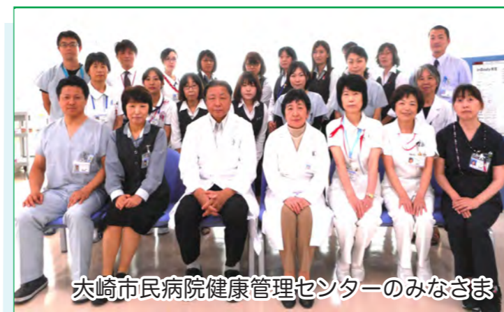
大崎市民病院健康管理センターのみなさま

平成 29 年度は、生活習慣病予防健診を中心に脳ドック・乳癌・子宮癌検診など延べ 13,319 人の方に利用頂きました。また、保険医療機関として二次健診外来、分院からの MRI 撮影の受入れ、インフルエンザ予防接種等も積極的に取り組んでいます。当センターでは、冬期間の利用者減対策として、期間限定で閑散期割引料金制度を設け、順調に予約が入っており、大崎地域並びに県北の専門の健診施設としての役割を果たしています。