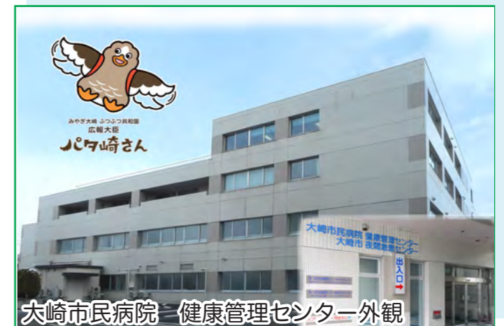
大崎市民病院 健康管理センター 外観