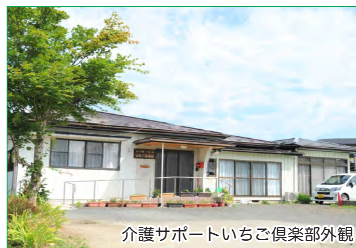
介護サポートいちご倶楽部外観

介護サービス事業所では、医療機関から提供された、お薬の情報や検査データなどを参考に、介護サービス提供の際に留意する点など検討することに活用し、介護サービス事業所からは、ケアプランなどの介護サービスの利用予定や実施状況などをMMWINにアップすることで、日常生活の状況について積極的に情報提供するようにしていきたいと考えています。将来的には、日常のバイタル情報などを介護サービス事業所から提供することで、血圧のコントロール状況などの把握にも活用でき、薬の効果や服用状況の確認の活用にも生かせると思っております。