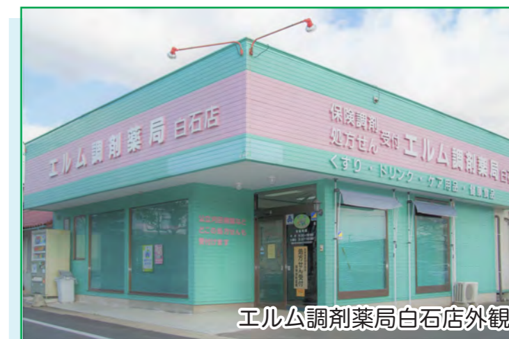
エルム調剤薬局白石店外観

薬局では、患者様の病名や検査データなどの診療情報を参照した服薬指導に活用し、薬局からは調剤を行った薬品情報や在宅患者の訪問報告などをMMWINにアップすることで、患者様の服用状況や副作用の有無など服用中の患者様の状況を情報提供しております。