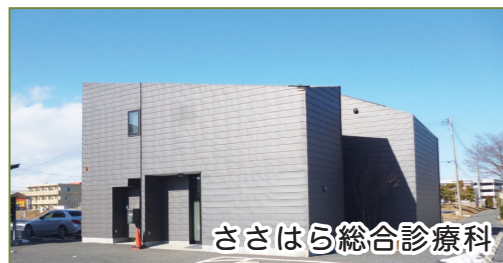
ささはら総合診療科

MMWIN の現状は患者さんの病状紹介、血液生化学検査値情報の共有が主で、画像に関してはコピー画像程度の低質画像でしたが、4月からCD画像よりもっと高質画像を提供する準備を進めているとのことです。これによりさらに詳細な情報を共有でき、患者さんの紹介や逆紹介もより迅速に、簡易に出来る事と思います。レ線、内視鏡、CT、MRI、MRA画像データが簡単に共有出来る事は私にとりましては願ってもない事ですし、多くの登録医も待ち望んでいたことと思います。