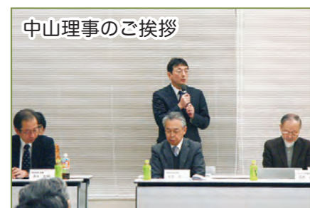
中山理事のご挨拶