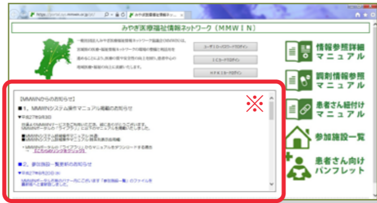
※こちらからも手順書をご確認頂けます。トップに表示されない場合は、スクロールしてご確認ください。

「MMWIN システム簡単操作マニュアル（共通）」や先月号の MMWIN 通信に同封致しました「紐付け簡易マニュアル」より、更に詳細な操作方法を参照頂けるマニュアルが、ポータルサイトのライブラリページよりダウンロード頂けます。