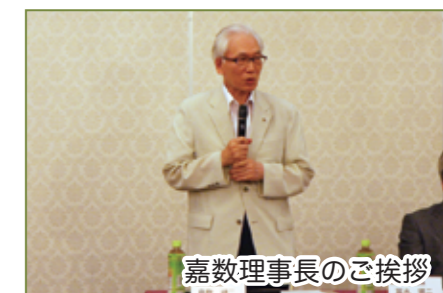
嘉数理事長のご挨拶