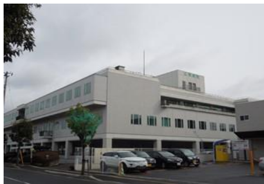
写真(イ) 加入申込対象 札